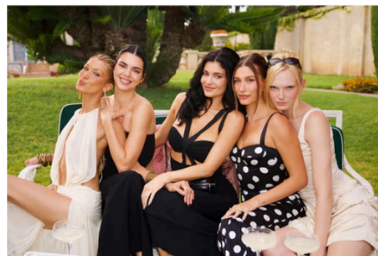
Bella Hadid, las hermanas Jenner, Hailey Bieber y Alex Consani (Harper's BAZAAR)

Y así, entre filtros dorados y sonrisas ensayadas, la línea entre clase social y belleza se desvanece.