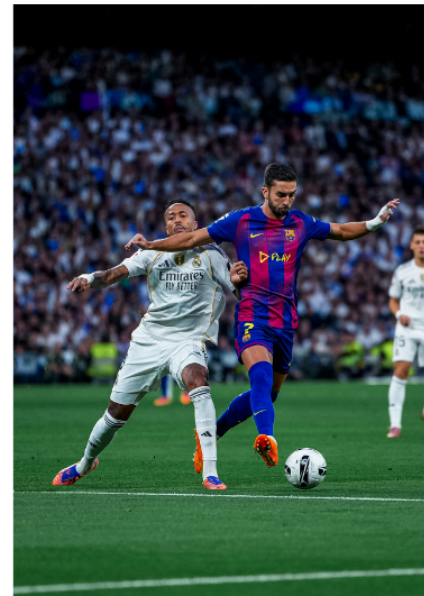
Éder Militão y Ferrán Torres

En el Santiago Bernabéu había un ambientazo, muy hostil hacia el 10 del Barcelona por sus declaraciones previas, la tarde del domingo 26 de octubre lo que hace que de partida el FC