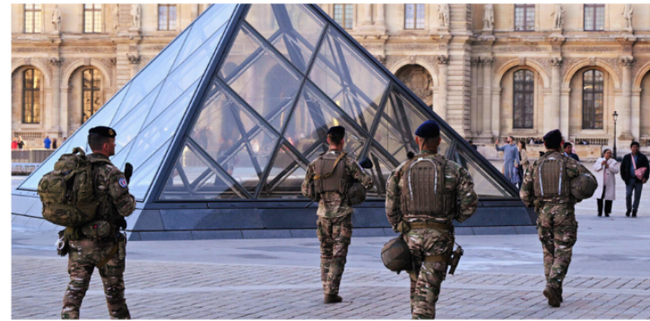
Militares enfrente del Louvre

El pasado 19 de octubre tuvo lugar un robo en el Museo del Louvre que ha marcado un antes y un después en la historia del arte. En apenas ocho minutos, una banda profesional de ladrones logró escapar con ocho joyas de la Corona francesa .