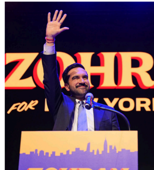
Mamdani saludando al público

Que haya sido el propio pueblo quien colocó en el poder, de forma justa, a un inmigrante, y que, además, haya sido clave el voto joven para lograrlo, simboliza una participación activa de este segmento de la población, inspiradora de cara a las elecciones generales de 2028 .