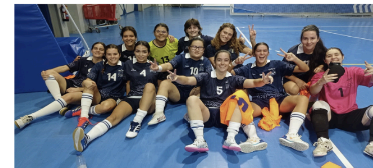
Las chicas de fútbol (UC3M)

Este miércoles 15 de octubre se celebró el primer partido de la temporada de fútbol femenino 25-26 de la UC3M, tras un mes de reincorporación a los entrenamientos. El equipo se enfrentó a la Universidad Alfonso X (UAX) este miércoles. Jugando fuera de casa, han logrado sumar su primer punto en la tabla.